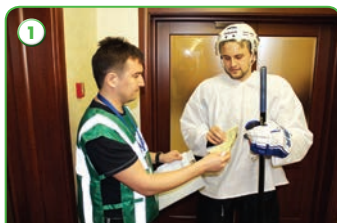
1 Уведомление спортсмена о необходимости сдать пробу