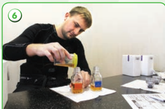
6 Разделение пробы по флаконам «А» и «В»