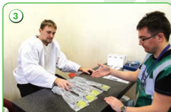
3 Выбор мочеприемника (емкости для сдачи пробы)