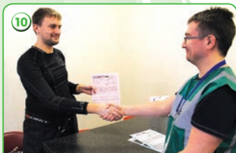
Окончание процедуры допинг-контроля