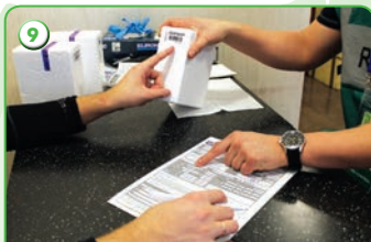
Заполнение протокола допинг-контроля и проверка внесенных данных