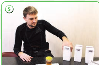
5 Выбор комплекта для хранения пробы