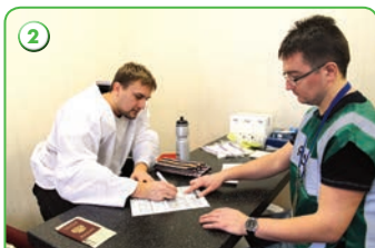
2 Регистрация на пункте допинг-контроля