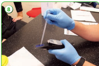
Проверка удельной плотности